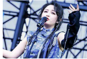
圈9(マルキウ) 湖南テレビ「超級女声」で40万人の中から優勝! 圧倒的な歌唱力と日本語力で日本の若者層に大人気。