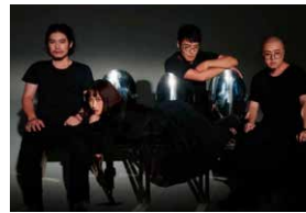
GriffO 鬼否(グリフォ) 中国国内の人気番組「バンドの夏」でブレイク! 今年注目のポップバンド、全員が中国美術学院卒業。