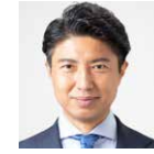
事務総長 青柳 陽一郎 (衆議院議員)