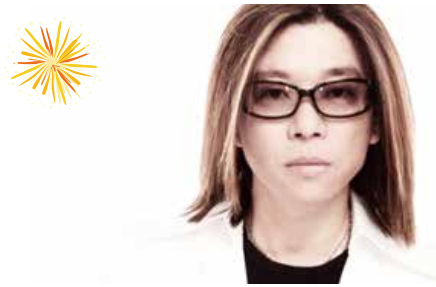
郭峰(グオ・フォン) 1990年には中国代表として、広島平和コンサート、横浜博覧会、太平洋博覧会、アジア音楽祭など、日本の主要な国際音楽イベントに参加。