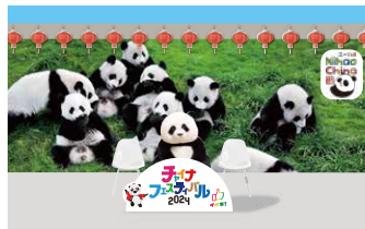
パンダモニュメント パンダフォトスポットがありますので、ぜひ記念撮影してくださいね!