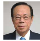
最高顧問 福田 康夫 (元内閣総理大臣)