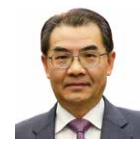
実行委員長 吳江浩 (中華人民共和国駐日本国特命全権大使)