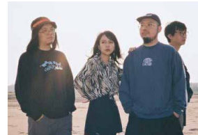
Chinese Football 世界中で活躍する武漢出身のハードロックバンド。2019年にロックシーンのレジェンド"american football"と共演。