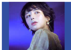
静電場朔(セイデンバ・サク) 世界で進行中のカルチャーを自身の視点で表現している。「古き」と「新しき」を融合させるニュータイプのアーティスト。