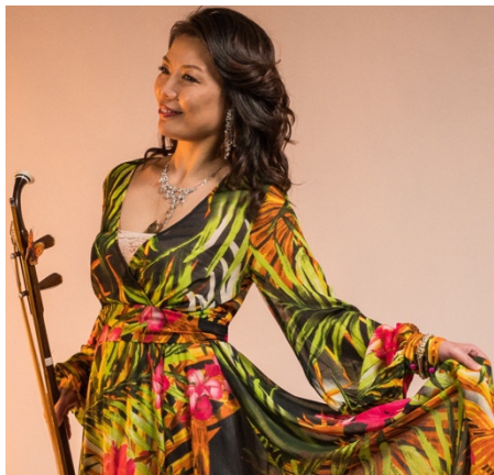
ウェイウェイ・ウー

日本からも、中国の伝統楽器・二胡奏者ら多数のアーティストが参加し、2日間のイベントを盛り上げます。