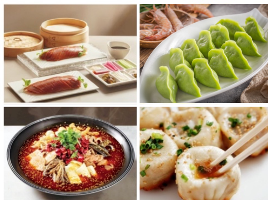
左上：北京料理（北京ダック）

中国といえば多彩な食文化。「チャイナフェスティバル 2024」では、北京、四川、上海、山東からなる「四大料理」など、魅力的な食文化が代々木公園に大集合。また、中国の国酒である白酒のブランド「汾酒」（ふんしゅ／フェンチュウ）などの「中国銘酒」をはじめとする奥深い中国酒文化を紹介します。