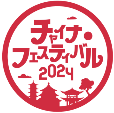
スタンプラリースタンプ