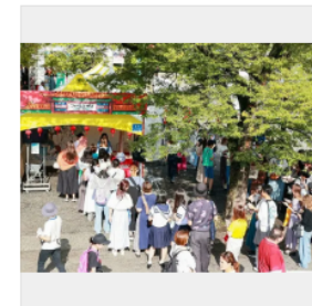
昨年の会場の様子

日中文化交流の祭典「チャイナフェスティバル」が9月7日・8日、代々木公園イベント広場（渋谷区神南2）で開催される。（シブヤ経済新聞）