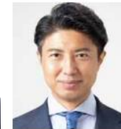
事務総長 青柳陽一郎 衆議院議員