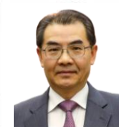
実行委員長 呉江浩 中華人民共和国駐 日本国特命全権大使