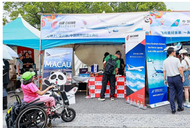
中国国際航空/マカオ航空