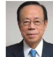
最高顧問 福田康夫 元内閣総理大臣