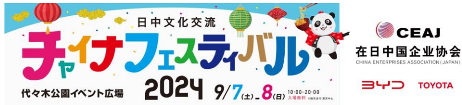
メインステージ看板