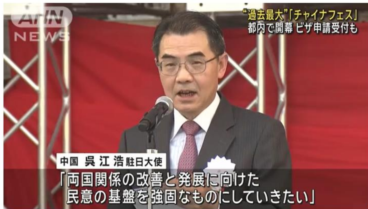
All Nippon NewsNetwork(ANN)

日中の交流を目的としたイベント「チャイナフェスティバル」が東京都内で始まりました。5回目となる今年は過去最大規模だということです。