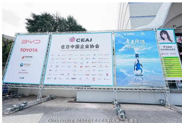
China Festival 2024.09.07-08 代々木公園 東京