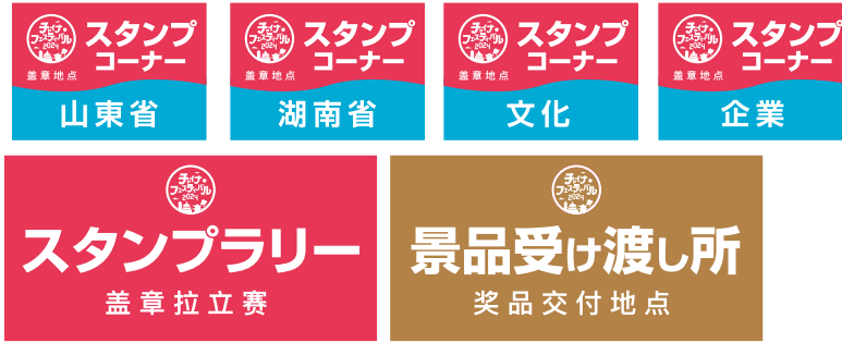
スタンプラリー案内看板