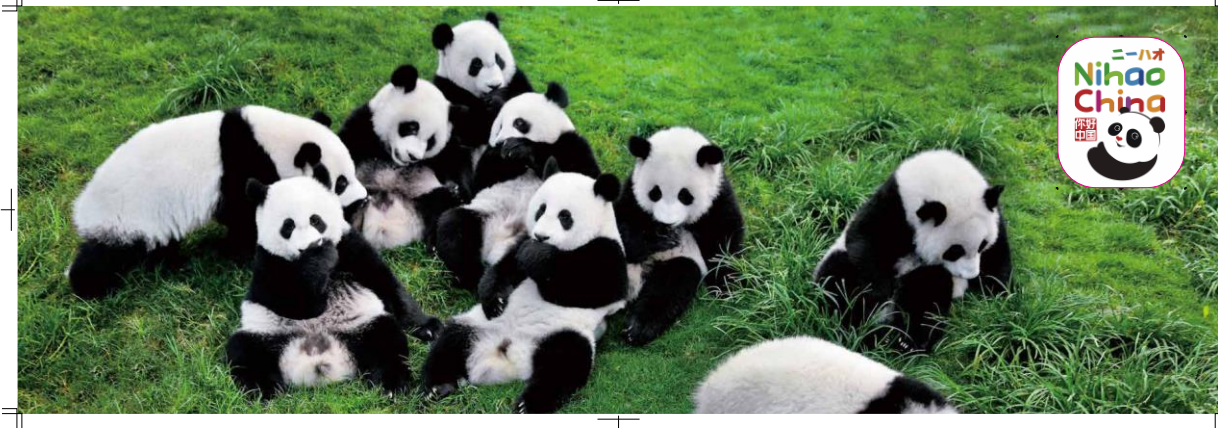
観光局モニュメント