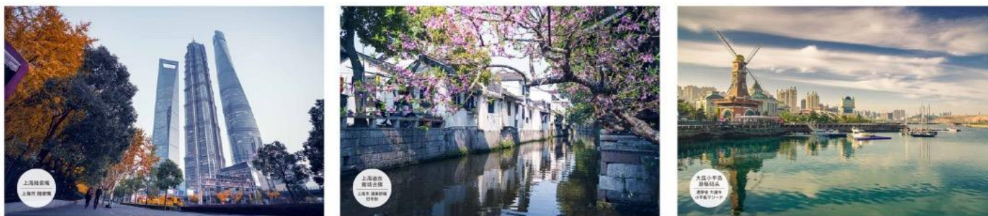
3連パネル W3600x H2400